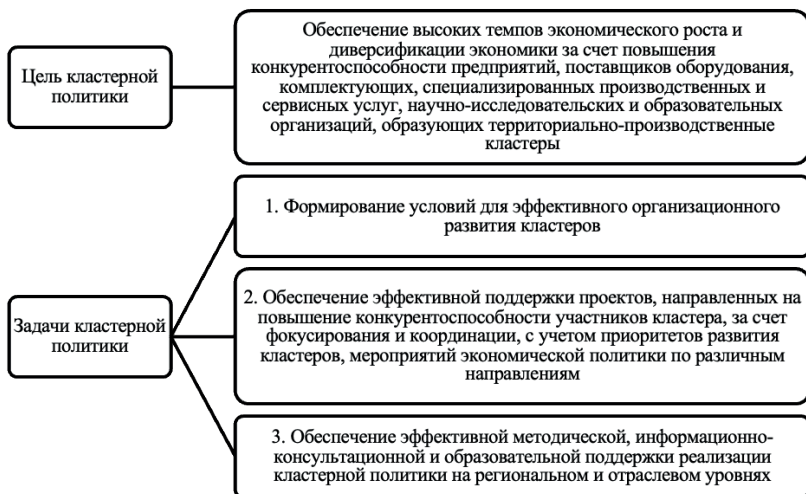
Рисунок 1. Цель и задачи кластерной политики России