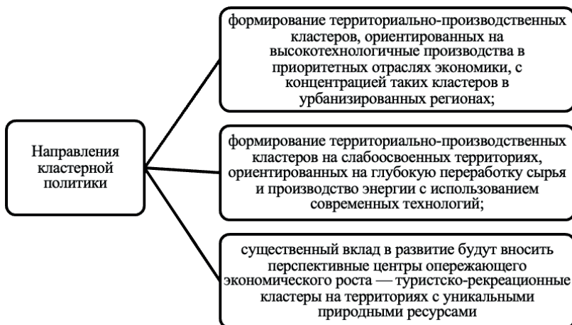
Рисунок 2. Направления кластерной политики, представленные в Концепции долгосрочного социально-экономического развития РФ