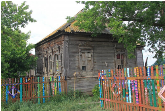
Рисунок 2. Пример до и после восстановительных работ силами волонтеров крестьянского дома в селе Поповка Хвалынского района Саратовской области

Еще один пример волонтерского проекта по благоустройству общественных пространств на сельских территориях — «Дом со львом». Команда проекта во главе с искусствоведом Юлией Тереховой проделала длительный путь от покупки разваливающегося крестьянского дома с уникальным расписным интерьером в селе Поповка Хвалынского района Саратовской области в 2010 году до завершения реставрационно-восстановительных работ в 2019 году (см. рис. 2). За эти годы было несколько волонтерских лагерей: добровольные помощники занимались расчисткой территории дома от мусора, укрепляли фундамент и многое другое. По итогу проекта дом был превращен в некоммерческий музей, став точкой притяжения для туристов, появились дополнительные возможности для заработка сельских жителей. Ежегодно музей «Дом со львом» посещают около 3 тыс. туристов.