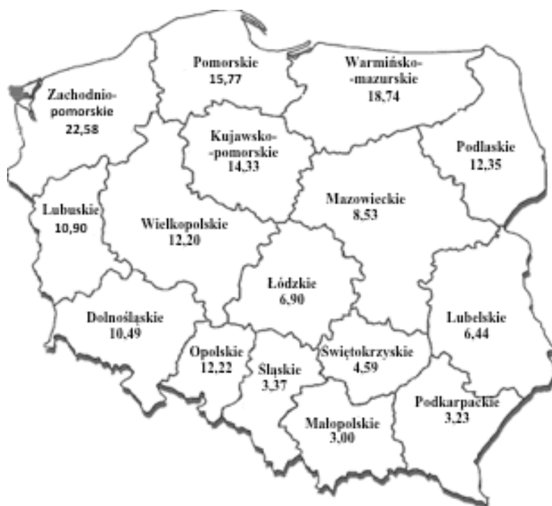
Рис. 2. Средняя общая площадь [га] подсобного хозяйства по воеводствам в 2010 г.