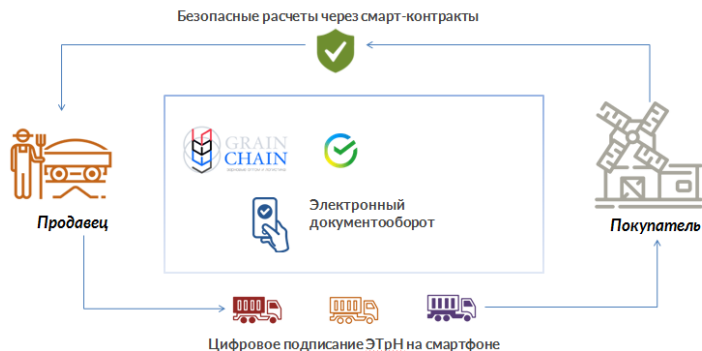
Рис. 3. Бесшовный контур GrainChain

При этом возникают сложности на этапе вовлечения участников рынка в работу на платформе, в том числе в связи с наличием работающих в серой зоне. Также не просматривается активный интерес к платформам, созданным фактически в форме стартапов, со стороны государственных ведомств, институтов развития, научного сообщества и крупных игроков рынка.